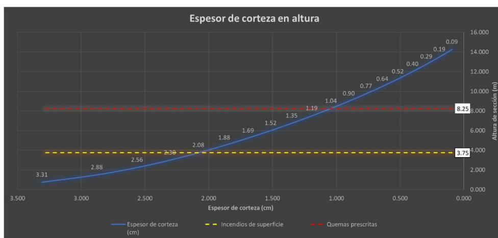
Imagen 4. Representación gráfica del espesor de corteza en altura y los límites de altura de llama para una quema prescrita y un incendio de superficie.